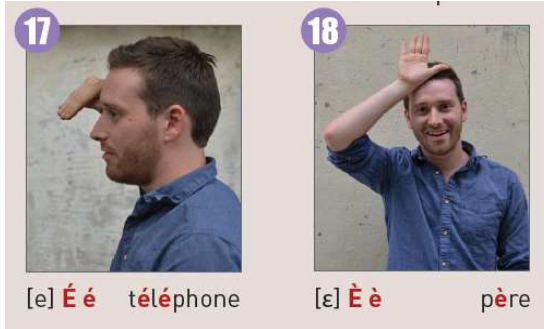
[e] É é téléphone